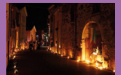
Via Valloscura illuminata durante la processione.

Anche quest'anno, dal 17 al 19 ottobre, si è svolta, nel migliore dei modi, la Festa della Madonna delle Grazie. I festeggiamenti sono terminati, come da tradizione, con la processione serale del lunedì. Come sempre la partecipazione della popolazione è stata massiccia e sentita. A presiedere la cerimonia religiosa è arrivato il Vicario Generale della Diocesi, don Lorenzo Zaupa.