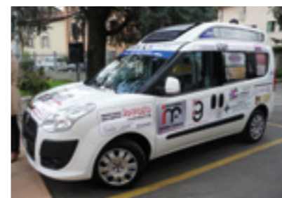
Automezzo, ricevuto grazie alle sponsorizzazioni, normalmente utilizzato per i servizi domiciliari

Alla base di queste prestazioni sono però fondamentali le capacità umane degli operatori che devono essere in grado di ascoltare e di comprendere il disagio di chi, dopo una vita vissuta in autonomia, ha la necessità di aver bisogno di aiuto.