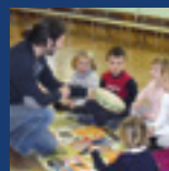
L'inglese a scuola